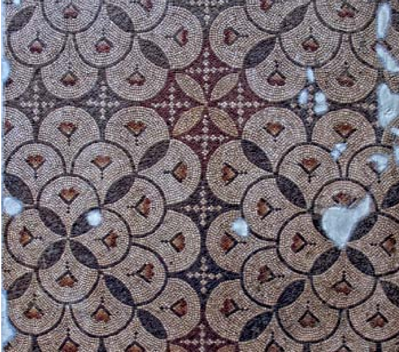
GEOMETRİK MOZAIK: M.S. V. YY. - ANTAKYA