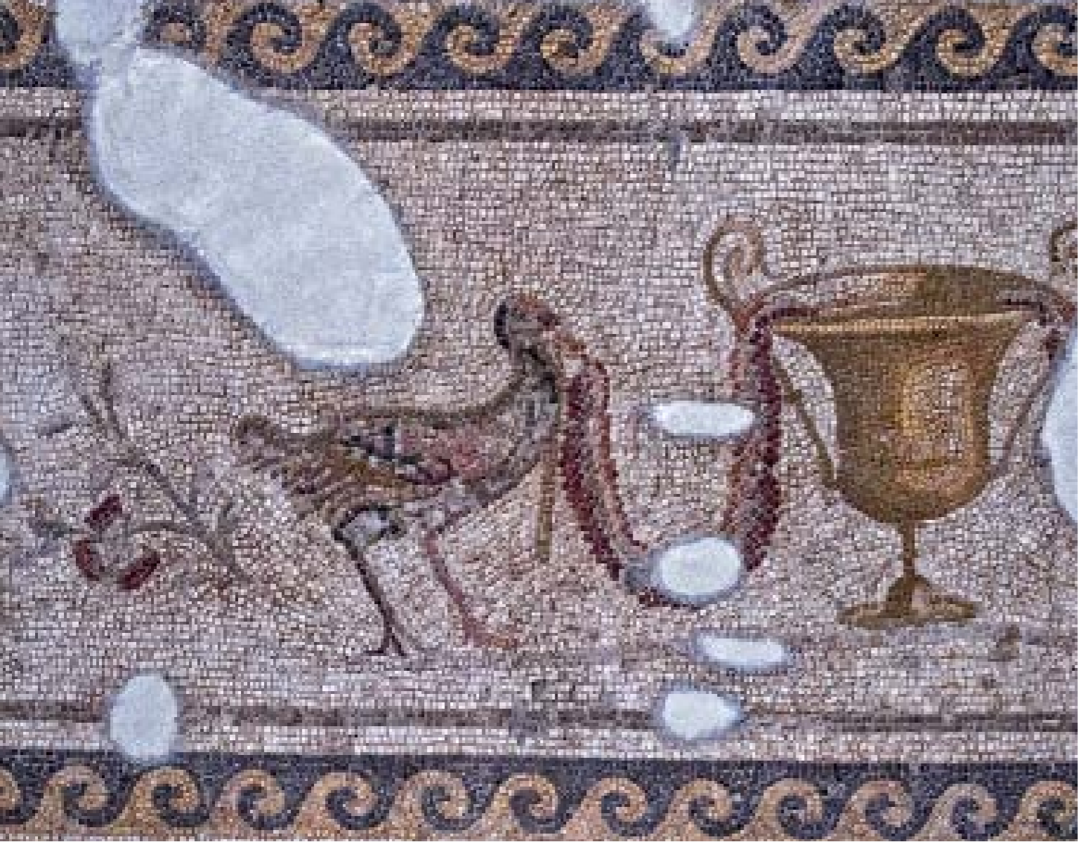
NARKİSOS MOZAIĐI DETAYI