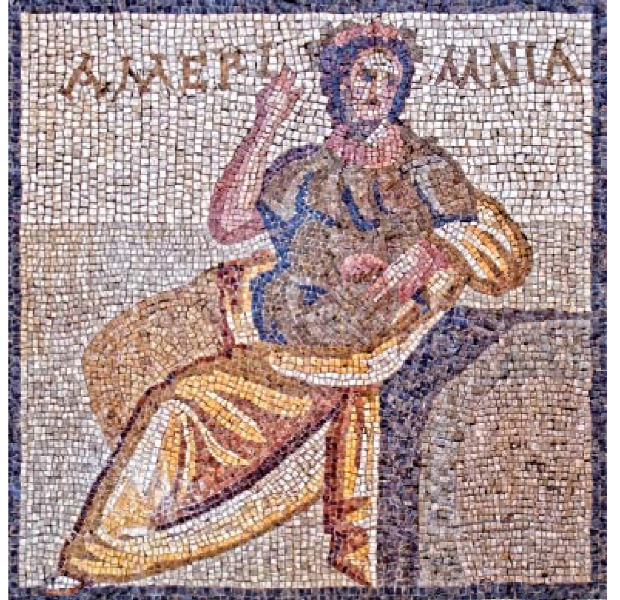
SÜKÜN MOZAIĞI: M.S. IV. YY. - ANTAKYA

Roma döneminde evlerin giriş kısmına nazarlık olarak yaptırılan türden bir mozaiktir. Üzerinde “kim baktığı mekan yada içindekiler hakkında ne düşünürse aynıysa ile karşılaşsın” anlamına gelen KAICY kelimesi yazmaktadır. Batıl inançları konu eden mozaiikte, sırtındaki dev çıkıntısı ile “Mutlu Kambur” elinde değnekler tutarak yürümektedir.