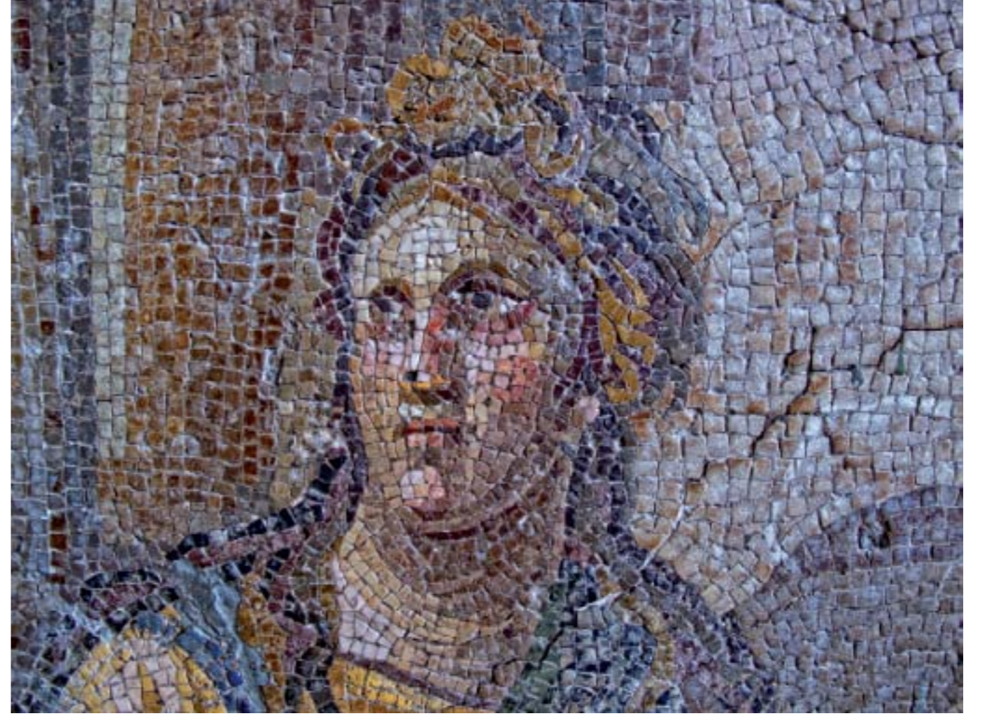
İSİS'E AİT SEREMONİ MOZAIĐI DETAYI: M.S. II. YY. - DEFNE (HARBİYE) - YAKTO