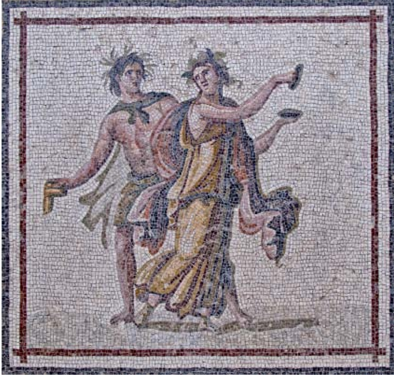
DANSÖZLER MOZAIĞI: M.S. II-III. YY. - SAMANDAĞ

Soldaki panoda genç bir satyr, sağ elinde bir müzik aleti (syrinx) tutmakta, onun önündeki maenad (şarap tanrısının perisi) ise, kolları ve vücudu ile sağa doğru kıvrılırken, elindeki zilleri çalarak saytr'a bakmaktadır. İkisinin de başı, çelenklerle süslüdür. Sağdaki panoda ise daha yaşlıca bir satyr, benzer figürlerle daha yaşlıca bir maenad ile dans etmektedir