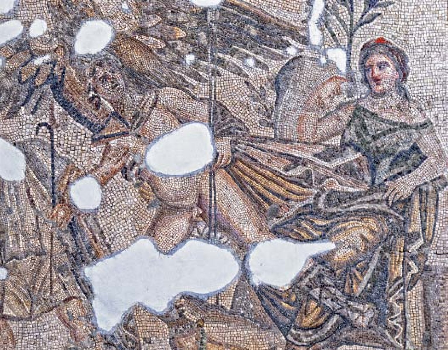
TARSUS MOZAIĞI: M.S. III. YY. - TARSUS