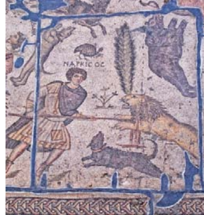
YAKTO MOZAIĞI DETAYI