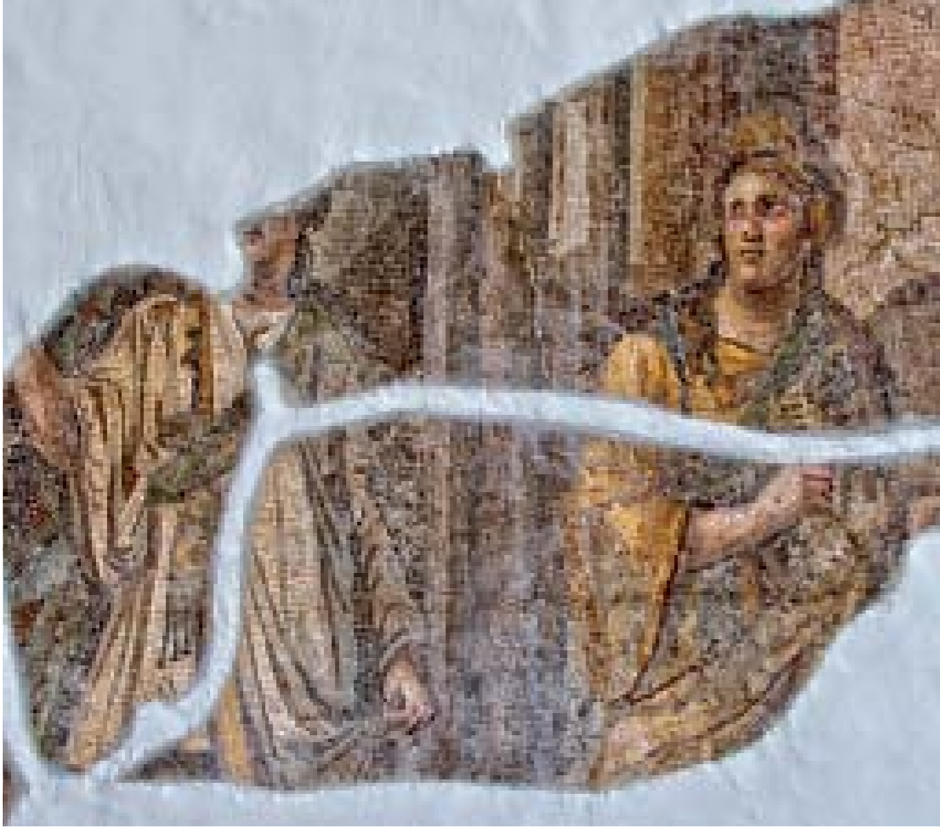
İSİS'E AİT SEREMONİ MOZAIĐI: M.S. II. YY. - DEFNE (HARBİYE) - YAKTO