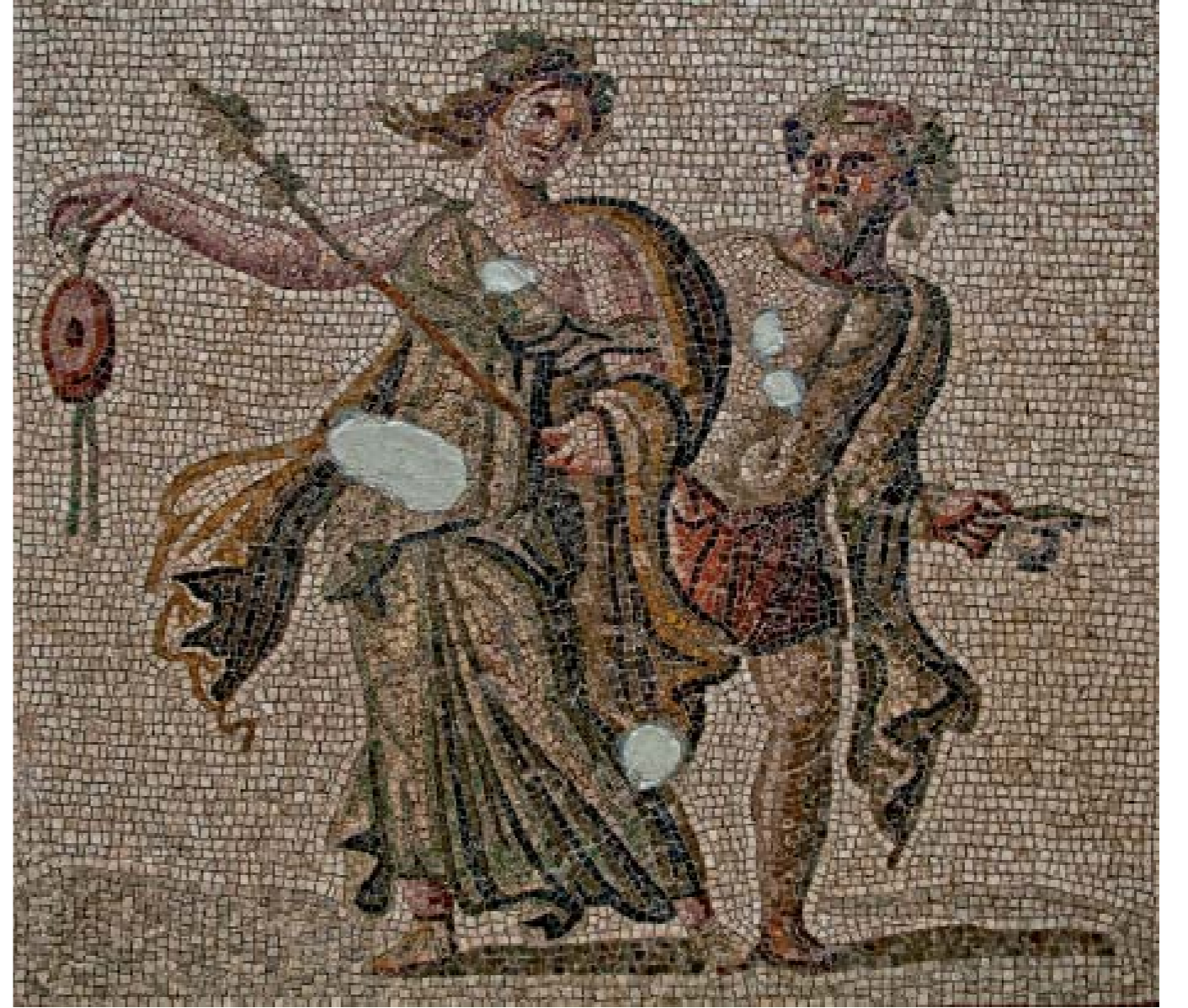
DANSÖZLER MOZAIĞI: M.S. II-III. YY. - SAMANDAĞ

Soldaki panoda genç bir satyr, sağ elinde bir müzik aleti (syrinx) tutmakta, onun önündeki maenad (şarap tanrısının perisi) ise, kolları ve vücudu ile sağa doğru kıvrılırken, elindeki zilleri çalarak saytr'a bakmaktadır. İkisinin de başı, çelenklerle süslüdür. Sağdaki panoda ise daha yaşlıca bir satyr, benzer figürlerle daha yaşlıca bir maenad ile dans etmektedir