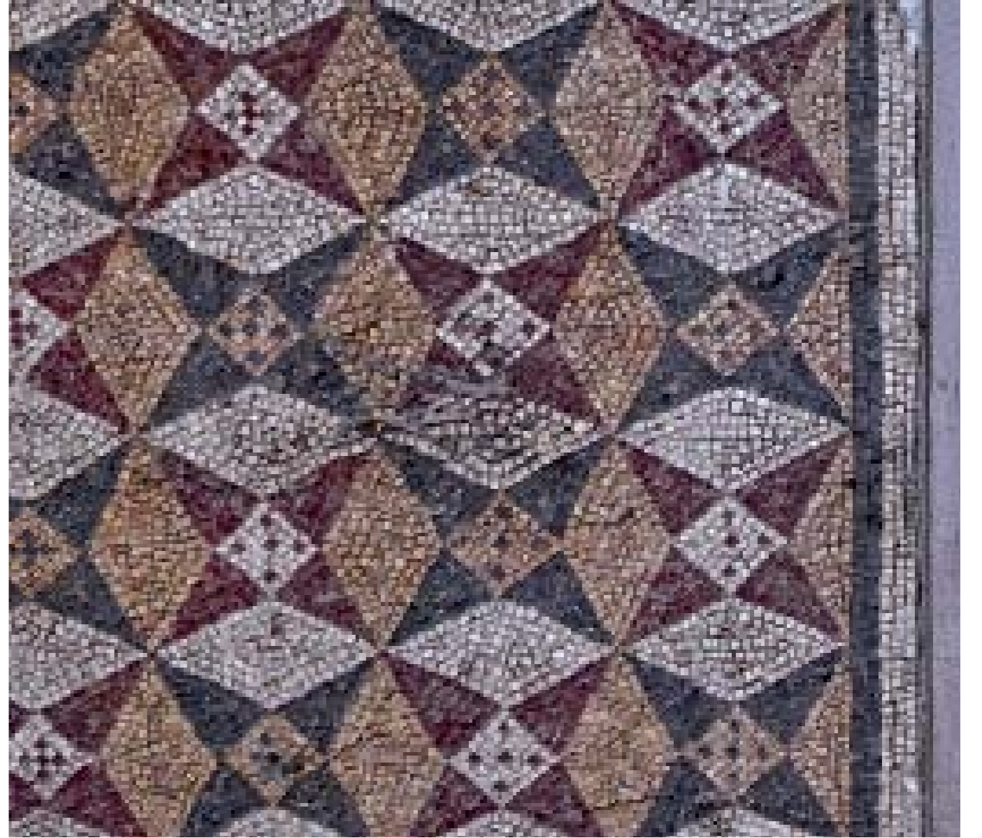
NARKİSOS MOZAIĐI DETAYI