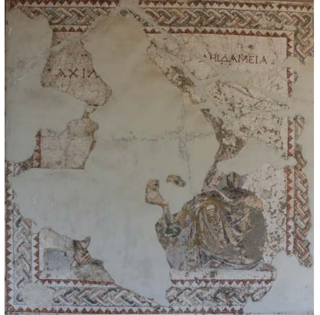
ACHİLES VE DİEDEMEİA MOZAIĞI: M.S. II. YY. - SAMANDAĞ

Dış bordür siyah, pervaz kırmızı, yeşil, beyazdır. Siyah olan içi, çerçeve içinde yine içi yeşil yapraklarla tezyin edilmiş siyah renkte bir daire mevcuttur. Asıl yazı beyaz zemin üzerindeki büstün soluna iki sıra halinde yazılmıştır. Atletin saçları çok muhtelif renkleri ihtiva etmektedir. Ara çerçevenin köşeleri çiçek dalları ile tezyin edilmiştir.