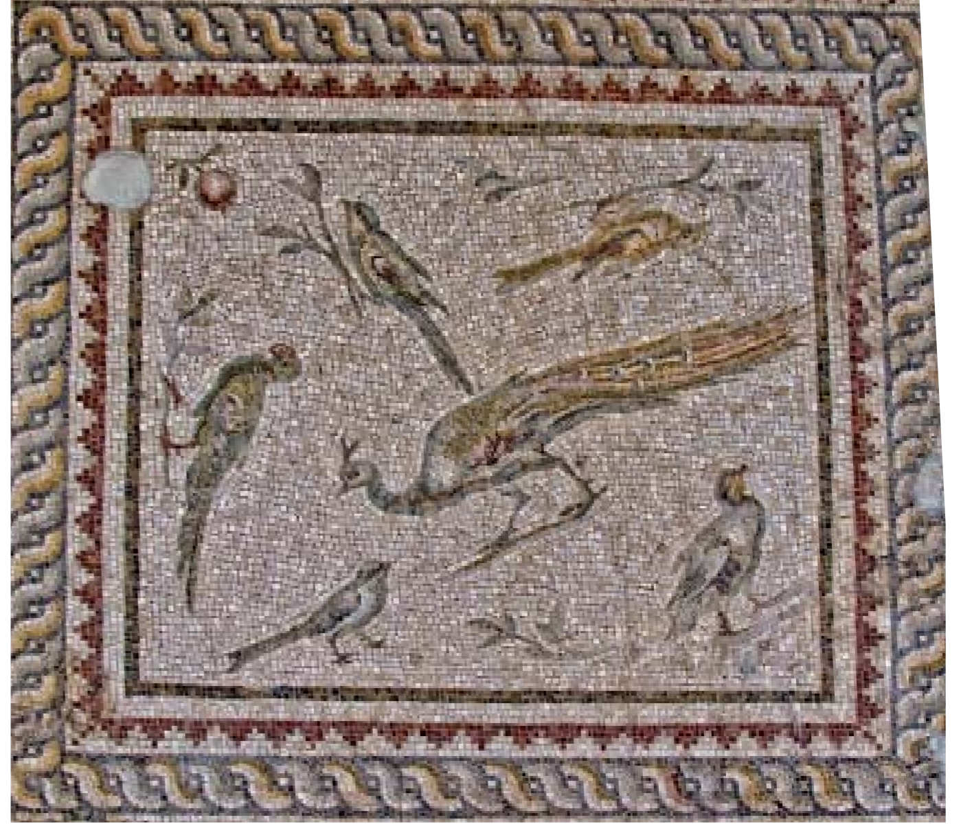
KUŞLAR VE ROZET MOZAIĞI: M.S. II. YY. - DEFNE (HARBIYE)

Ayakta neşeli bir şahıs saate bakmaktadır. Yazıda, Grekçe ile “dokuzu geçiyor” yazılıdır. Güneş saatinde, grup on ikide olduğuna göre, günlük çalışma sona ermiş, artık eğlence ve istirahat saati başlamış demektir. Şahsın elbisesinin üst kısmı beyaz ve gri-yeşil ile sol omuz üzeri menekşe cam ile karıştırılmıştır. Mantosu sarı ve hafif olarak bejle gri ve parlak beyaz gölgelendirilmiştir. Sütun gri ile parlak beyaz, koyu gri gölgeli, Basite (güneş saati)’nin üstü siyahtır.