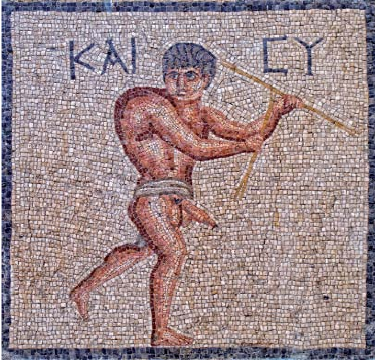
BAHTİYAR KAMBUR MOZAIĞI: M.S. II. YY. - ANTAKYA

Roma döneminde evlerin giriş kısmına nazarlık olarak yaptırılan türden bir mozaiktir. Üzerinde “kim baktığı mekan yada içindekiler hakkında ne düşünürse aynıysa ile karşılaşsın” anlamına gelen KAICY kelimesi yazmaktadır. Batıl inançları konu eden mozaiikte, sırtındaki dev çıkıntısı ile “Mutlu Kambur” elinde değnekler tutarak yürümektedir.