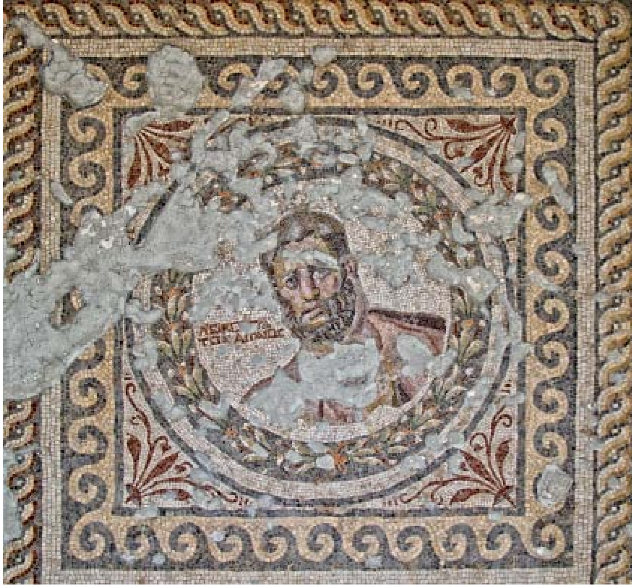
ATLET MOZAIĞI: M.S. III. YY. - SAMANDAĞ

Dış bordür siyah, pervaz kırmızı, yeşil, beyazdır. Siyah olan içi, çerçeve içinde yine içi yeşil yapraklarla tezyin edilmiş siyah renkte bir daire mevcuttur. Asıl yazı beyaz zemin üzerindeki büstün soluna iki sıra halinde yazılmıştır. Atletin saçları çok muhtelif renkleri ihtiva etmektedir. Ara çerçevenin köşeleri çiçek dalları ile tezyin edilmiştir.