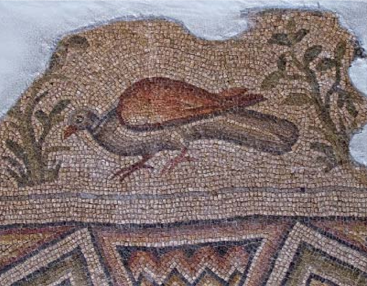
KUŞLAR MOZAIĞI DETAY