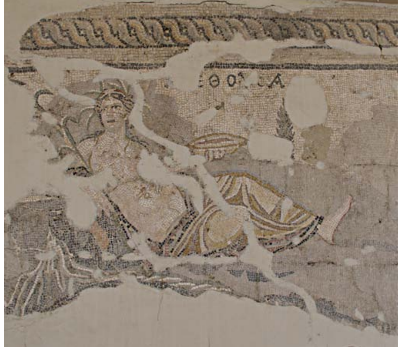
ARETHUSA MOZAIĞI: M.S. V. YY. - İSKENDERUN

Mitolojide ilkbahar tanrıçası olarak Ananeosis'in, bitkilerin doğup büyümesinden ve meyve vermesinden sorumlu olduğuna inanılırdı. Madalyon içinde genç bir kadın olarak tasvir edilen Ananeosis'in giysilerinde Bizans etkisi bulunmaktadır. Geç Roma döneminin bir eseri olan mozaığın etrafında ayrıca, çiçeklerle süslenmiş rozetler yer almaktadır.