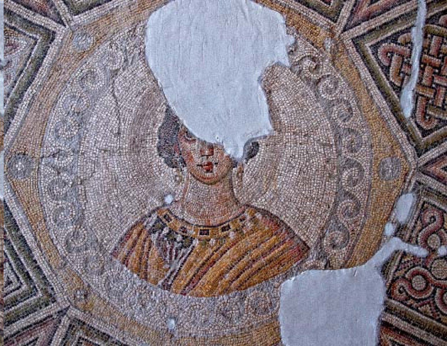
KUŞLAR MOZAIĞI: M.S. V. YY. - ANTAKYA

Bir evin döşemesi olarak yapılmış olan mozaikte çeşitli kuşlar resmedilmiştir. Merkezde başı haleli kadın büstü bulunmaktadır. Cepheden tasvir edilmiş kadın portresinin kulaklarında küpeleri dikkat çekicidir. Bordürü kuşlar, çiçeklerle dekoreli olup geometrik şekillerle sınırlandırılmıştır.