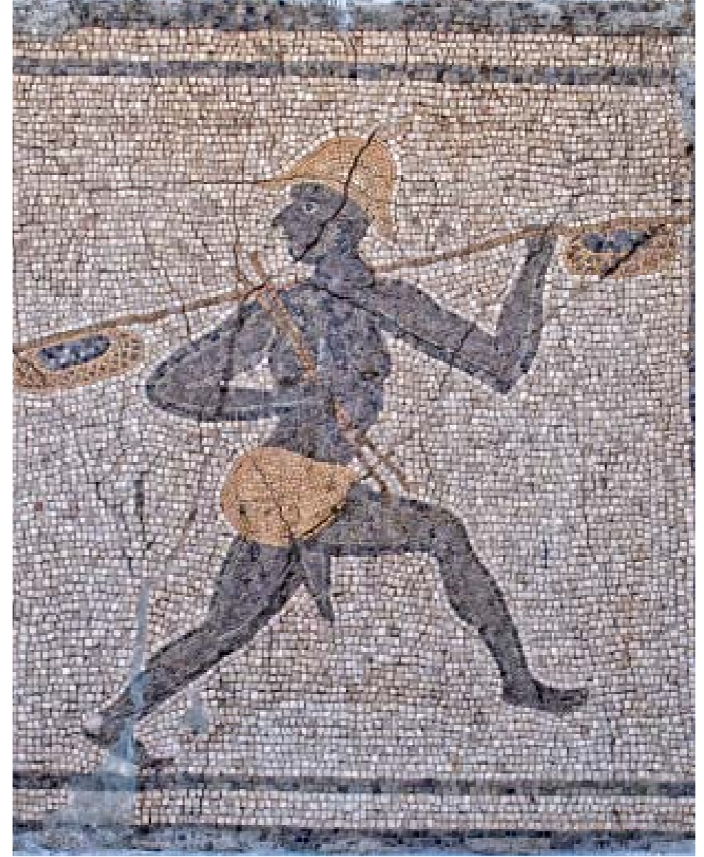
ZENCİ BALIKÇI MOZAIĞI: M.S. II. YY. - ANTAKYA

Arkasına bakarak koşan bir zenci balıkçı, sol elinde, iki ucunda birer sepet olan bir sırık taşımaktadır. Sağ elinde ise iki değnek olan zenci balıkçının siyah parlak gözleri ve geniş siperli bir şapkası vardır