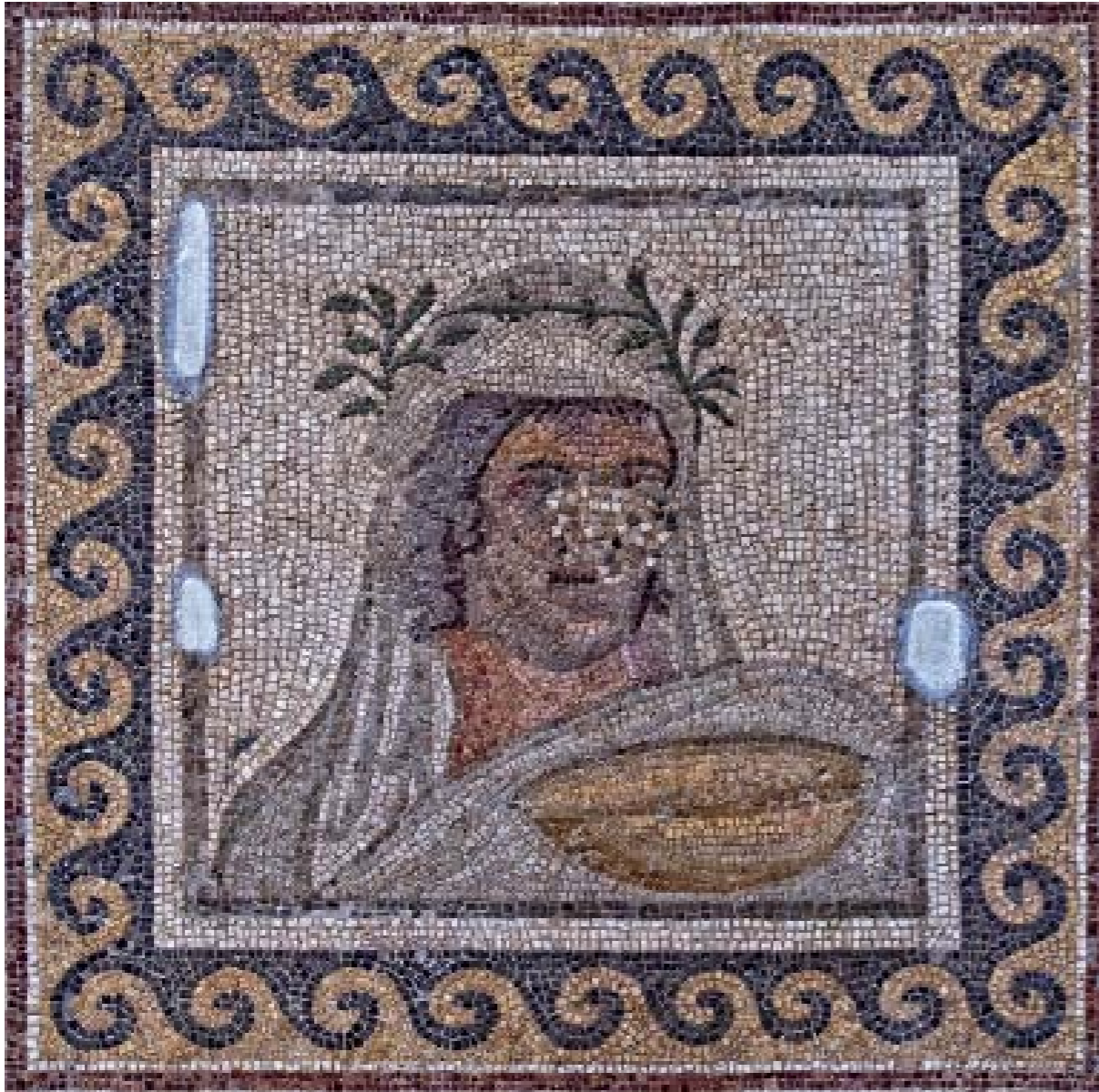
NARKİSOS MOZAIĞI DETAYI