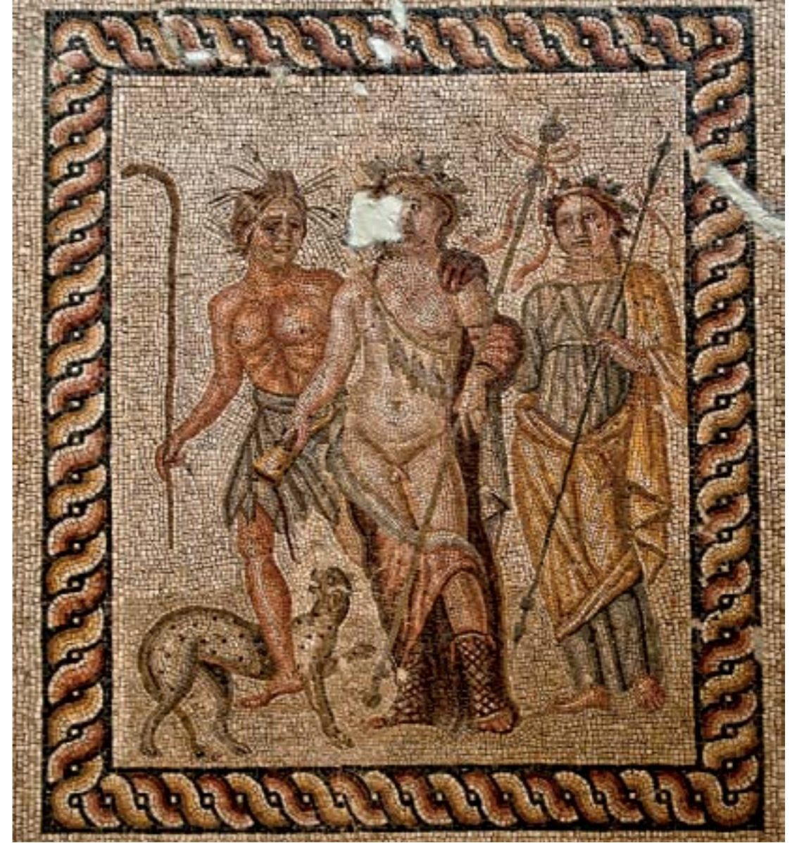
SARHOŞ DİONYOS MOZAIĞI: M.S. II. YY. - ANTAKYA

Yunan mitolojisinde şarap, bereket ve bitki tanrısı olarak yer alan Dionysos, bu mozaiikte bir maniad (şenliklerde kendisine refakat eden kadın) ve bir satyros ile resmedilmiştir. Dionysos'un kadehinden dökülen şarabı ise satyrosun bacakları arasındaki panter içmektedir. Satyroslar doğayı simgeleyen cinlerdir. Dionysos alayında yer alırlar.