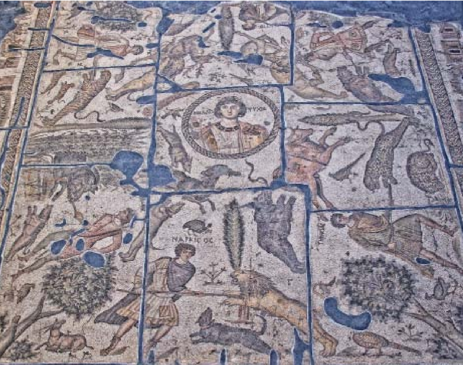
YAKTO MOZAIĞI: M.S. V. YY. - DEFNE (HARBIYE)