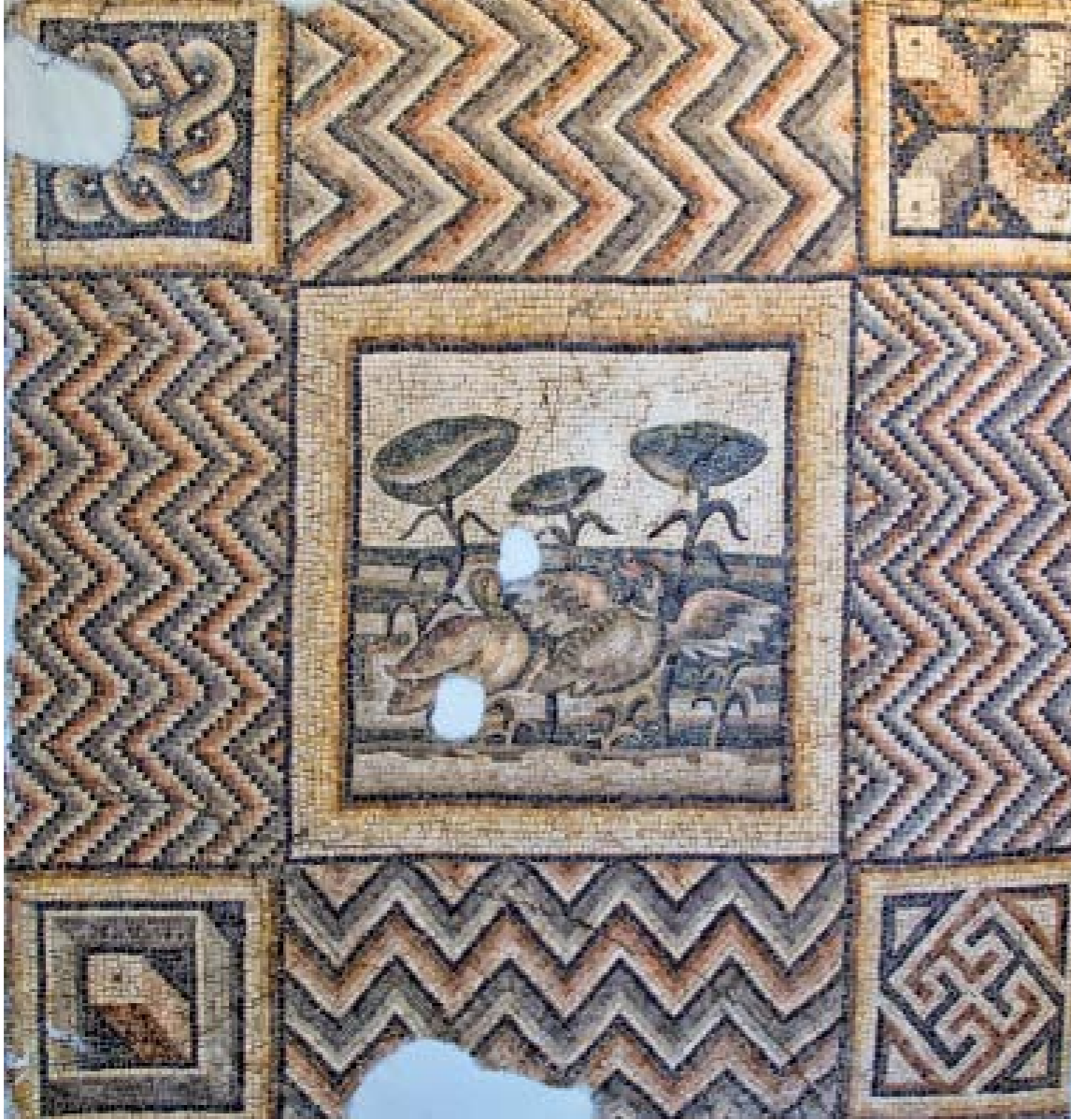
BALIKLAR VE ÖRDEKLER MOZAIĐİ: M.S. III. YY. - DEFNE (HARBIYE)

Dörtgen Őekil süslemeli paneller daha büyük geometrik dörtgenlerle çevrilmiŐ halde birbirini takip eden, birbiri üstüne gelen düzenlemeli bantlıdır.