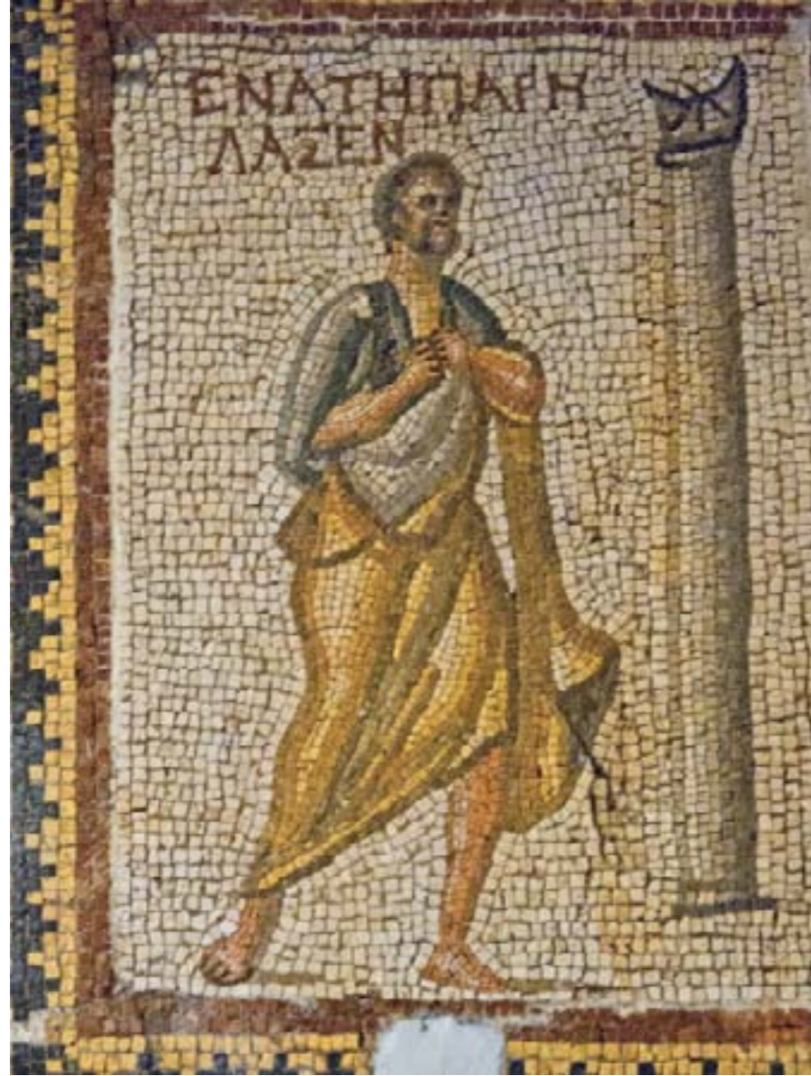
GÜNEŞ SAATİ MOZAIĞI: M.S. IV. YY. - DEFNE (HARBIYE)

Ayakta neşeli bir şahıs saate bakmaktadır. Yazıda, Grekçe ile “dokuzu geçiyor” yazılıdır. Güneş saatinde, grup on ikide olduğuna göre, günlük çalışma sona ermiş, artık eğlence ve istirahat saati başlamış demektir. Şahsın elbisesinin üst kısmı beyaz ve gri-yeşil ile sol omuz üzeri menekşe cam ile karıştırılmıştır. Mantosu sarı ve hafif olarak bejle gri ve parlak beyaz gölgelendirilmiştir. Sütun gri ile parlak beyaz, koyu gri gölgeli, Basite (güneş saati)’nin üstü siyahtır.