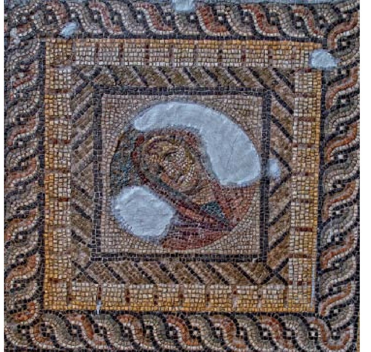
DİONYSOS'UN ZAFER ALAYI MOZAIĞI DETAY: M.S. III. YY. - DEFNE (HARBİYE)

Roma ve Yunan mitolojisine göre Dionysos Çal'lı şarap tanrısıdır. Bağ bozumu tanrısı olarak da bilinir. Halk tarafından diğer tanrılara göre daha çok benimsenen Dionysos adına bir çok festival ve bağ bozumu şenlikleri düzenlenmiştir. Bu şenliklerde bir koro bulunmaktaydı; daha sonraları koronun önüne bir oyuncu, daha sonra ikinci bir oyuncu geçmiş, böylece tiyatronun temelleri atılmıştır.