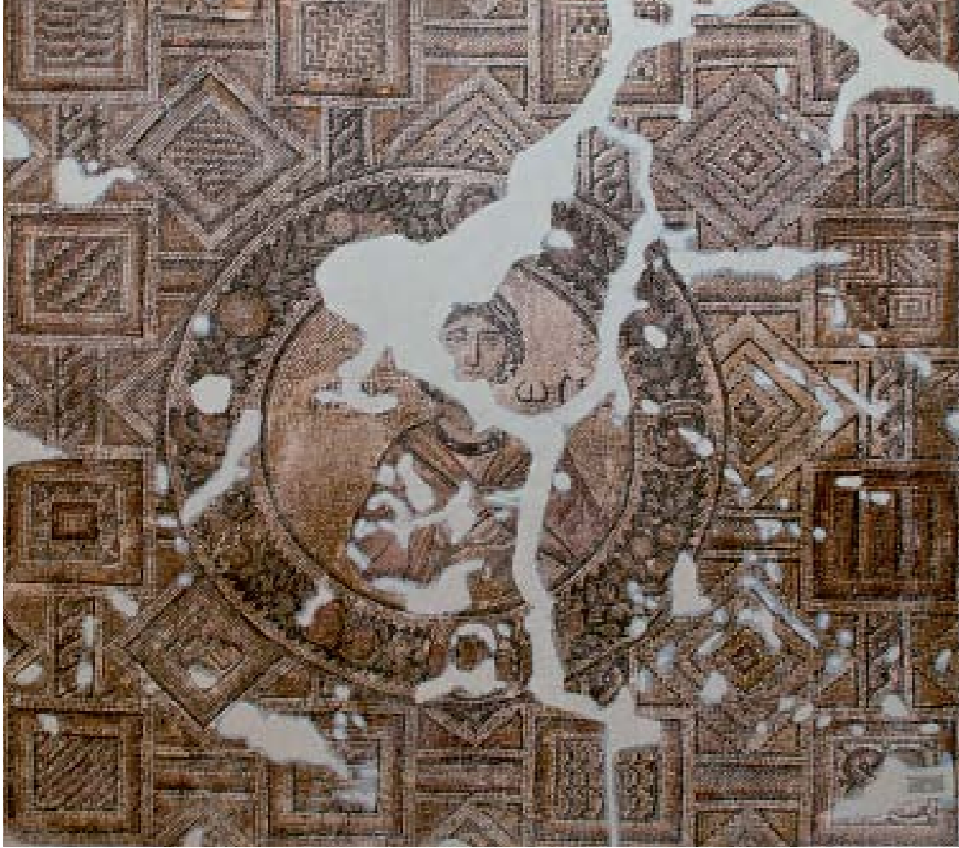
ANANEOSİS MOZAIĞI: M.S. V. YY. - ANTAKYA

Mitolojide ilkbahar tanrıçası olarak Ananeosis'in, bitkilerin doğup büyümesinden ve meyve vermesinden sorumlu olduğuna inanılırdı. Madalyon içinde genç bir kadın olarak tasvir edilen Ananeosis'in giysilerinde Bizans etkisi bulunmaktadır. Geç Roma döneminin bir eseri olan mozaığın etrafında ayrıca, çiçeklerle süslenmiş rozetler yer almaktadır.