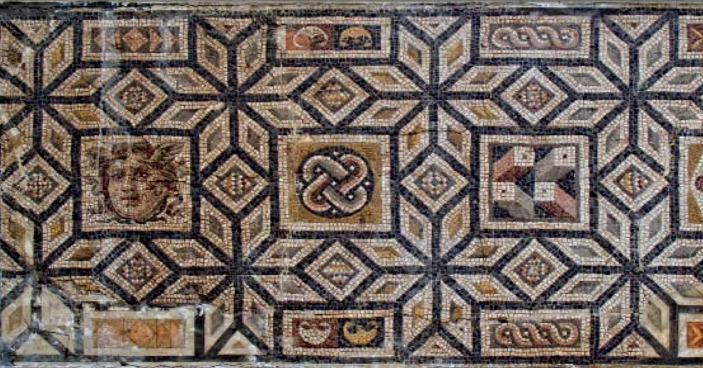
GEOMETRİK MOTİFLİ MOZAIK: M.S. III. YY. - DEFNE (HARBİYE)