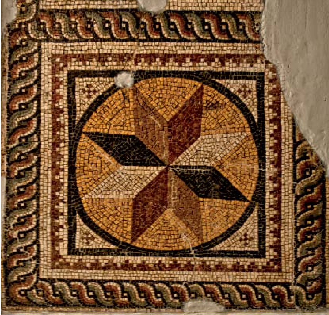
GEOMETRİK DESEN MOZAIĞI: M.S. V. asırda