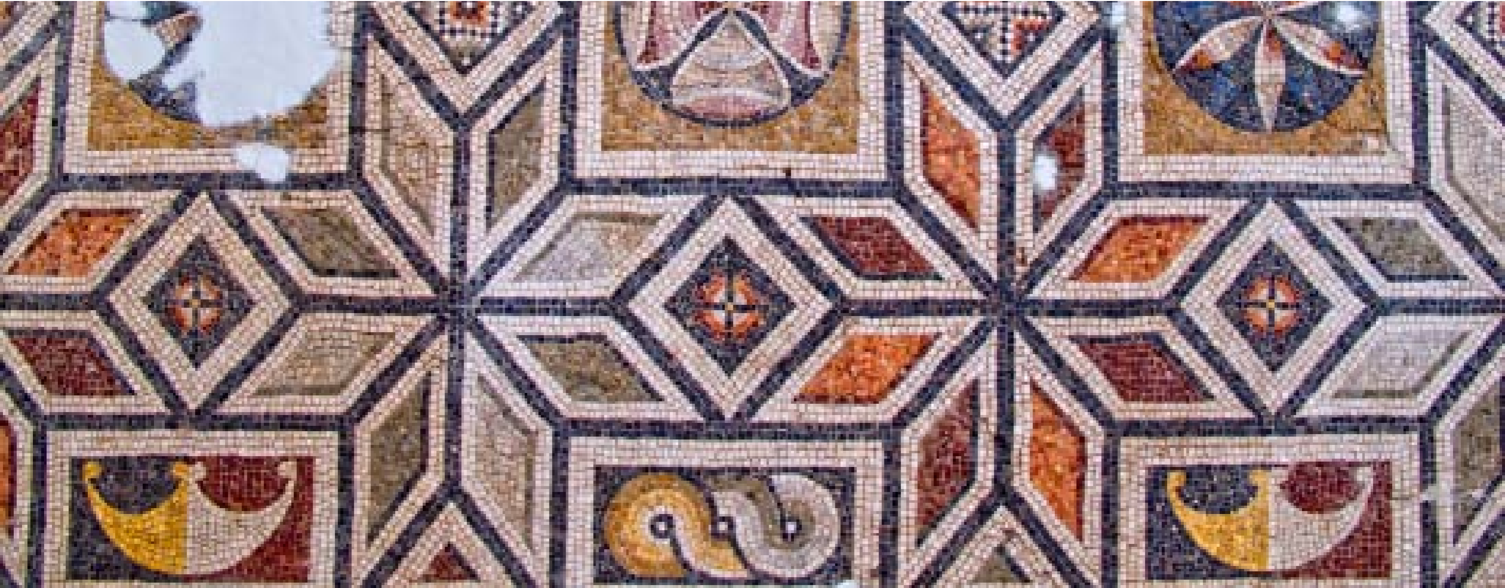
TERKEDİLMİŞ ARIADNE MOZAIĞI DETAYI