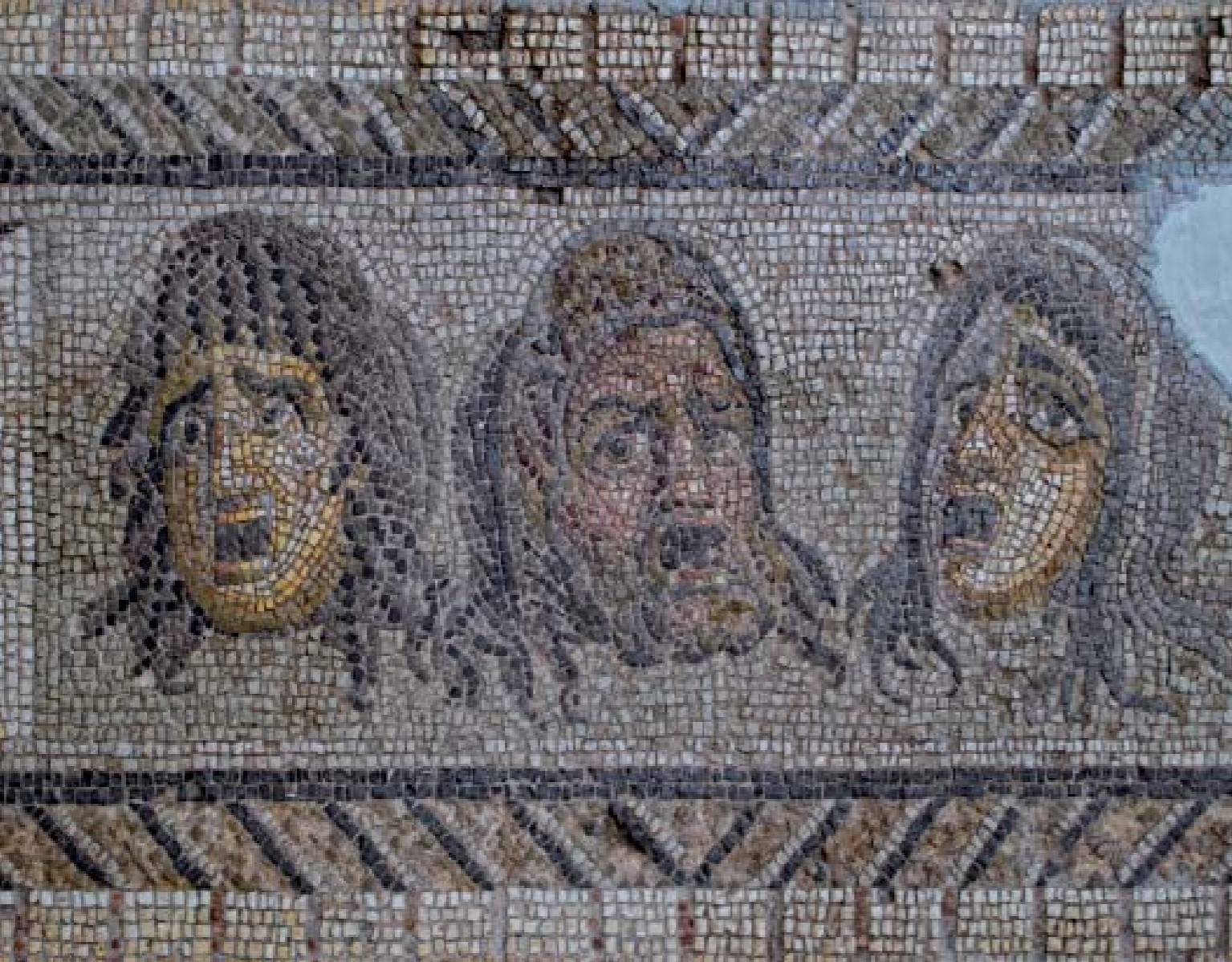
DİONYSOS'UN ZAFER ALAYI MOZAIĞI DETAY: M.S. III. YY. - DEFNE (HARBİYE)

Roma ve Yunan mitolojisine göre Dionysos Çal'lı şarap tanrısıdır. Bağ bozumu tanrısı olarak da bilinir. Halk tarafından diğer tanrılara göre daha çok benimsenen Dionysos adına bir çok festival ve bağ bozumu şenlikleri düzenlenmiştir. Bu şenliklerde bir koro bulunmaktaydı; daha sonraları koronun önüne bir oyuncu, daha sonra ikinci bir oyuncu geçmiş, böylece tiyatronun temelleri atılmıştır.